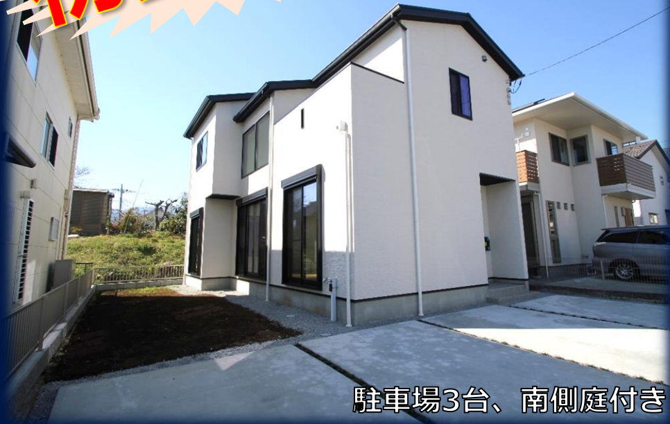
駐車場3台、南側庭付き