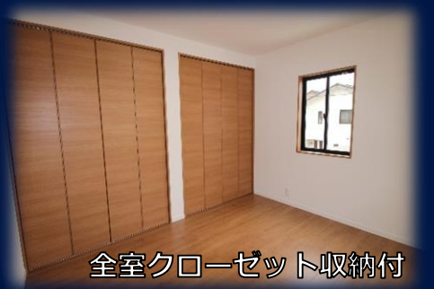
全室クローゼット収納付