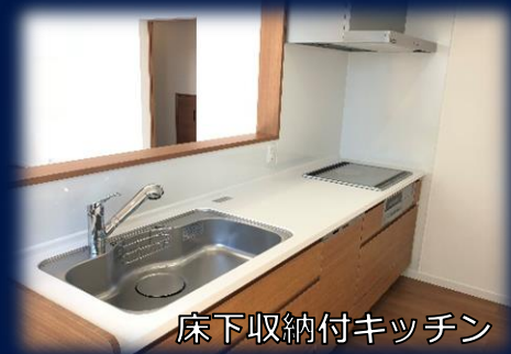
床下収納付キッチン