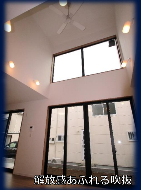
解放感あふれる吹抜